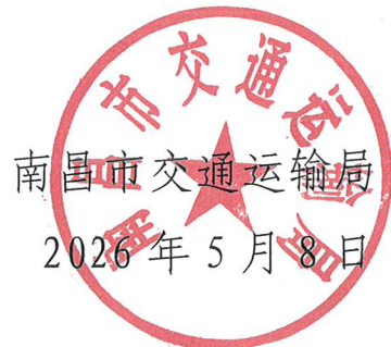
南昌市交通运输局