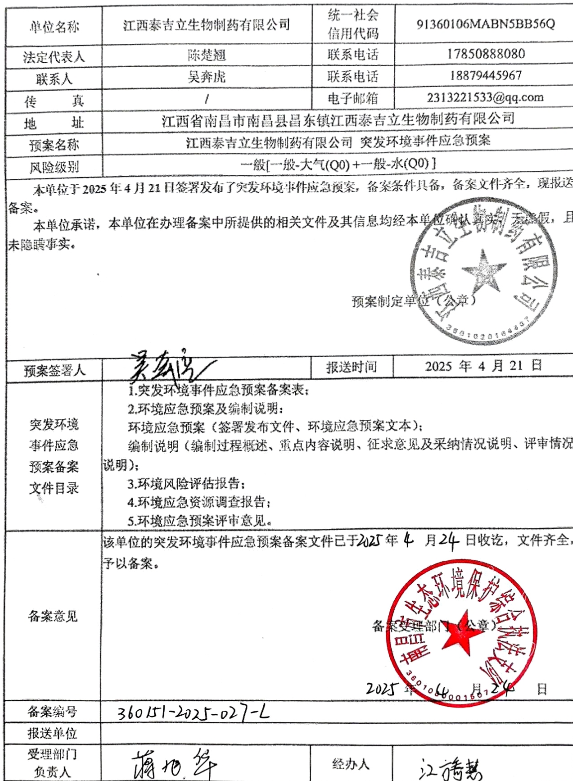
企业事业单位突发环境事件应急预案备案表