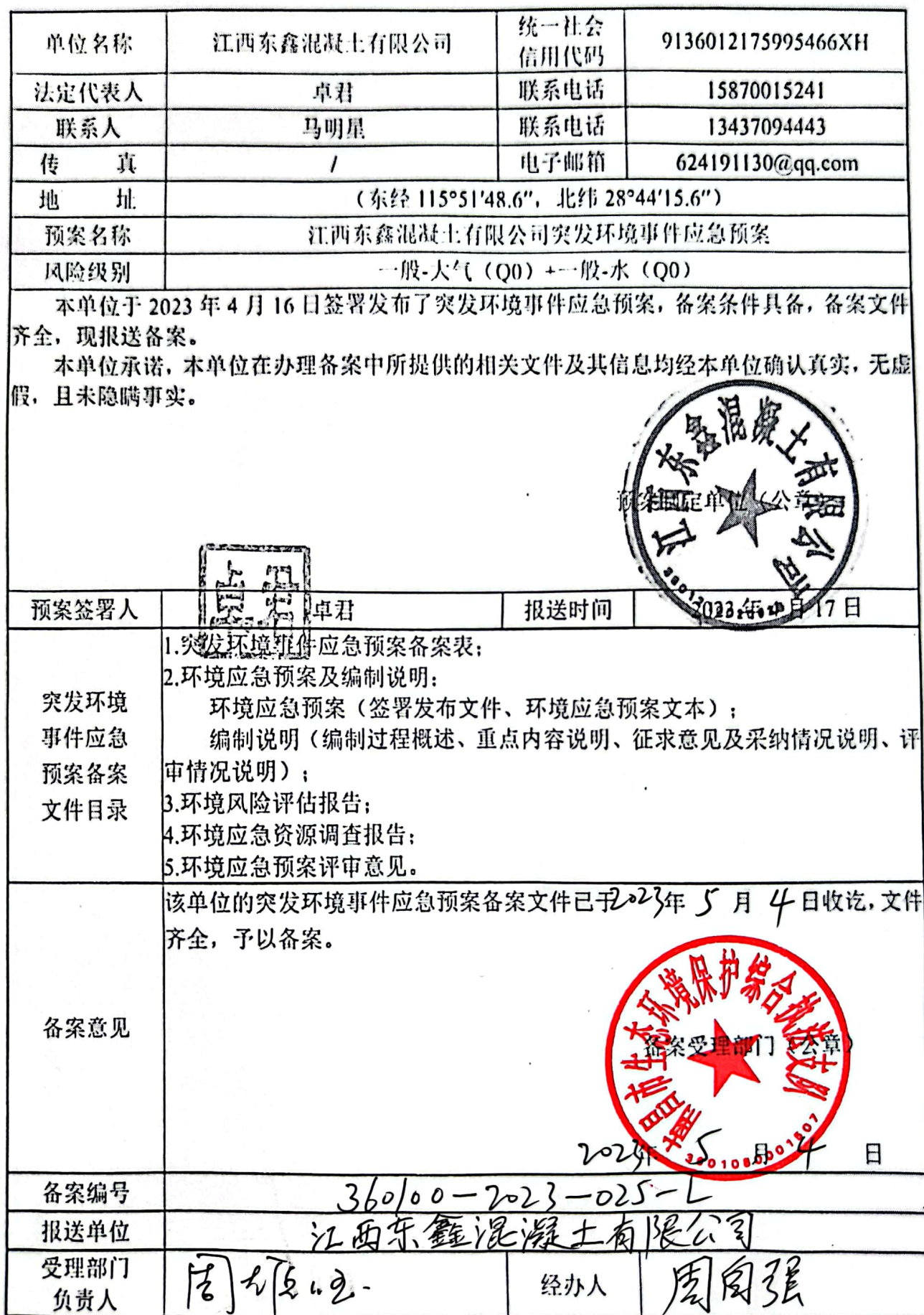
企业事业单位突发环境事件应急预案备案表